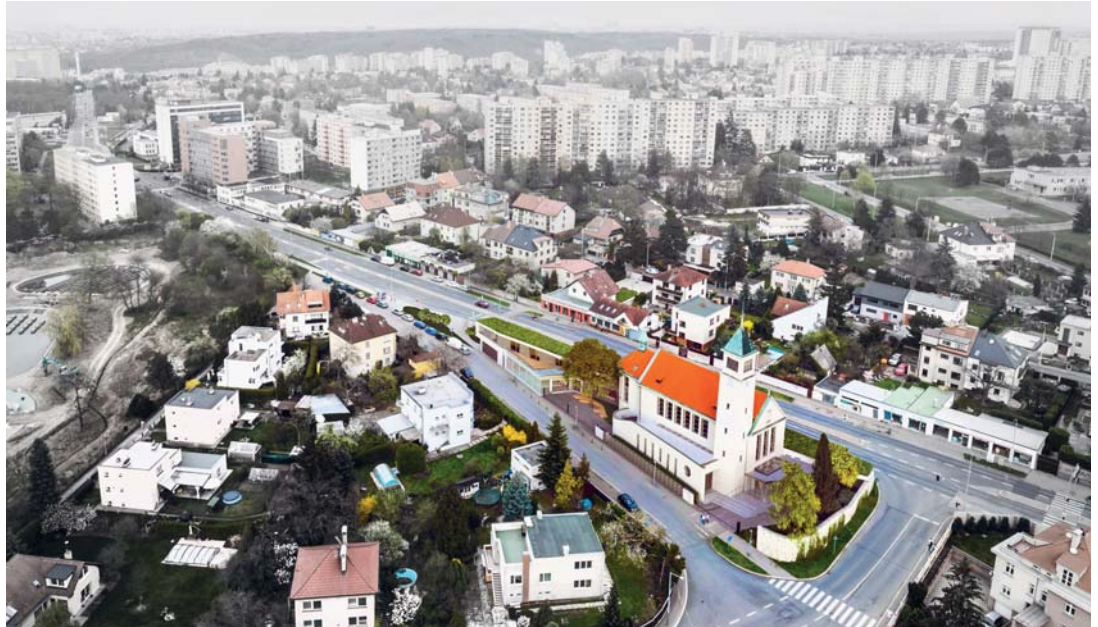
Plánované Centrum Lhotka v okolní zástavbě.