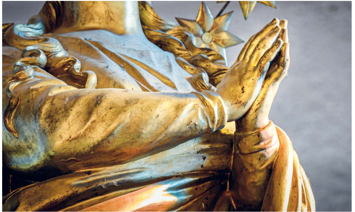
Sepjaté ruce lhotecké Immaculaty.