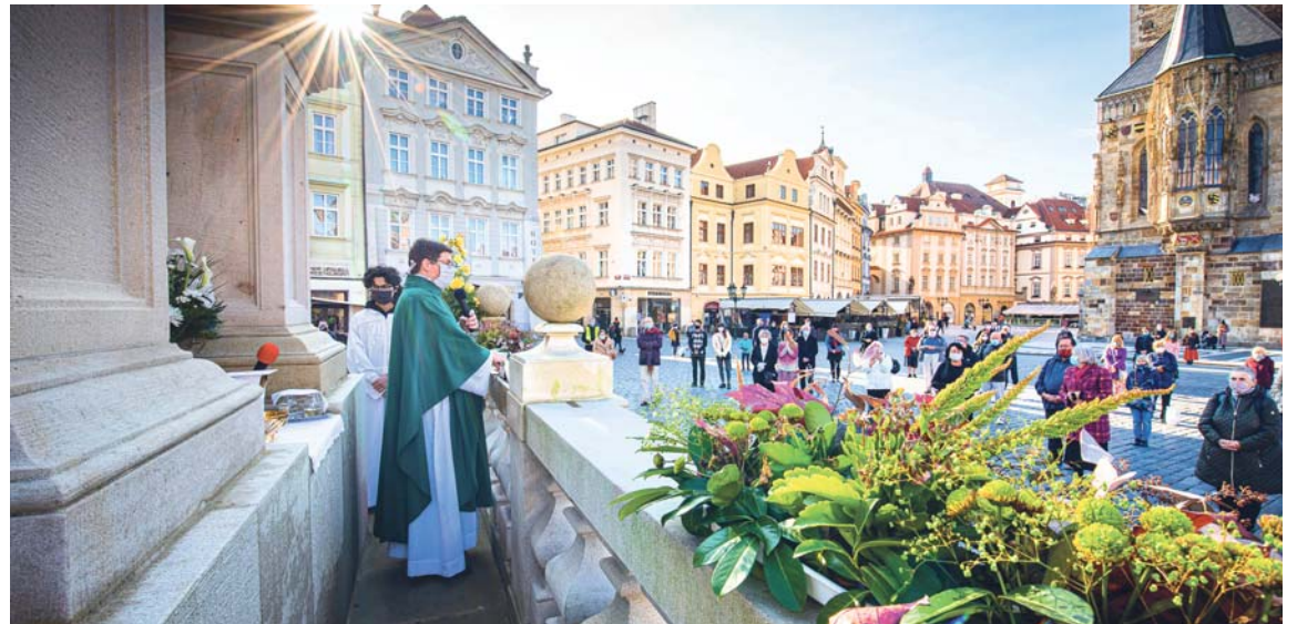
Bohoslužba v pandemii u Mariánského sloupu na Staroměstském náměstí.

Z obnovení Mariánského sloupu jsem měl velkou radost. I proto, že je spjat s naším kostelem. Ten byl postaven jako jeden z dvanácti kolem Prahy, stejně jako byl počet hvězd na gloriole kolem Mariiny hlavy na odčinění hříchu jeho stržení. Jedna z hvězd je dokonce v kostele uchovávána.