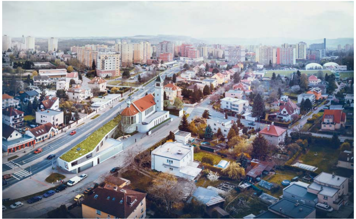
Centrum Lhotka se podle návrhu neuzavírá hledajícím a kolemjdoucím. Dvě nádvoří před farním domem a před kostelem zvou a nabízejí možnost navštívit chrám všem, kteří hledají své duchovní ukotvení. Vizualizace Štěpán Kotous

Objekt se neuzavírá ani hledajícím a kolemjdoucím. Dvě volně přístupná nádvoří před farním domem a před kostelem zvou a otevírají možnost navštívit stavbu všem, kteří hledají své duchovní ukotvení.