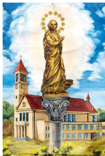
Lhotecký kostel a zboření Mariánského sloupu na Staroměstském náměstí vyobrazené na farním praporu.

Postupně, snad díky svému povolání architekta a zkušenosti s vyjednáváním na úřadech, jsem převzal projekční i inženýrskou činnost ohledně Mariánského sloupu. Naštěstí jsem mohl navázat na precizní projekt architekta Naumana, prvního předsedy