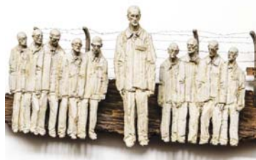
Sv. Maxmilián Kolbe.

Když nehledíme na sv. Maxmiliána pouze v kontextu posledních chvíli jeho života a mučednické smrti, ale celého jeho díla, zpozorujeme, že klíčem k pochopení této postavy je láska