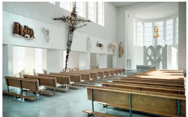
Tak by měl vypadat interiér chrámu po rekonstrukci.