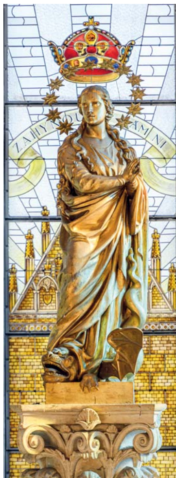
Panna Maria na Lhotce.

Alžběta byla naplněna Duchem Svatým a zvolala mocným hlasem: „Požehnaná tys mezi ženami a požeh-